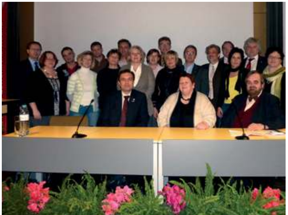
Die neu gegründete ARGE Fachgruppenvereinigung für Gesundheits- und Sozialberufe Oberösterreich

Im Abschluss seiner Rede verlangt Novakovic die sofortige Einführung die Wertschöpfungsabgabe und Aktientransaktionssteuer, um so die langfristige Finanzierung des Gesundheits- und Sozialsystems in Österreich zu sichern. ■